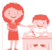
График проведения ВПР-2024

Профессиональные рекомендации специалистов помогут скорректировать его дальнейшую учебную деятельность.